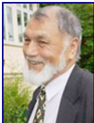
Алибой Йўляхшиев - таниқли мухолифат фаоли, Норвегия.